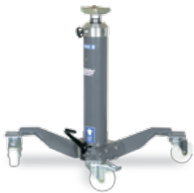
Getriebeheber Junior Jack 1,2 S

Tragfähigkeit: 4 x 5.500 kg Reifendurchmesser: 550 - 780 mm Hub: 1800 mm