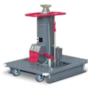
Bodenfahrbarer Grubenheber Blitz M 15-15 Basic

Tragfähigkeit: 15 t Hub: 800 mm Gewicht: 227 kg