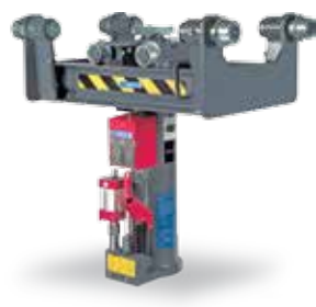
Hängende Grubenheber GHUSLP 15

Tragfähigkeit: 1.200 kg Hub: 1100 mm Druckluftanschluss: 6 bar